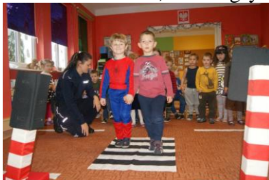
Wycieczka gr. III i IV do KWP