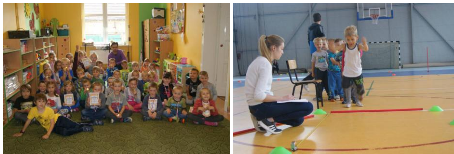
Dekoracja medalowa gr. III i IV