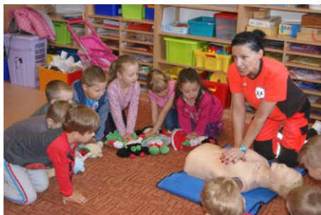
Fot. P. Giecewicz